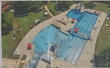
Gefährlich oder erfrischend? Aktuelle Vorfälle in Freibädern verunsichern.

ging die Kriminalität in vielen Bereichen des öffentlichen Lebens in den Pandemie-jahren vorübergehend zurück. Vor dem Hintergrund müssten die neuen Zahlen auch bewertet werden, heißt es aus dem Ministerium. Im Vergleich zum Vor-Pandemie-Jahr 2019 sei die Anzahl der Straftaten in Freibädern sogar um 14,9 Prozent gesunken. 2015 waren es 1888 Fälle.