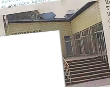
Hallenbad mit kleiner Innenstadt.

„Es stehen jetzt noch die gesuchten Vernehmungen an. Das braucht noch Zeit“, sagte der Polizeisprecher. Die Tatverdächtigen seien nach der mutmaßlichen Tat ermittlungsdienstlich festgenommen – also identifiziert – worden. Laut Polizei gibt es auch einen Verdacht, dass der Vorfall mitbekommen haben. Angaben dazu machte. Auch eine Vernehmung der Zeugen würden gesucht. Die 13-Jährige selbst sei im Beisein ihrer Angehörigen angehört worden, sagte der Polizeisprecher. Auch Opferschützer würden mit ihr aufnehmen, im Falle der Vernehmung solle man mit Ruhe und Empathie vorgehen.