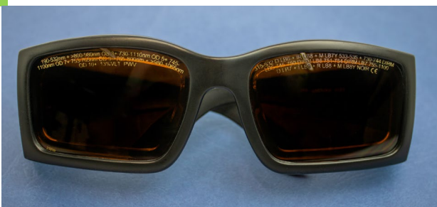
Abbildung 2 - Laserschutzbrille mit Kennzeichnung auf dem Brillenglas und mit Kennzeichnung am Brillengestell

Geeignete Laser-Schutzbrille tragen. Weitergehende Informationen finden Sie in der DGUV Information 203-042 [3].