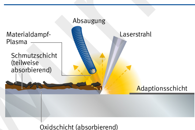
Abbildung 1 – Prinzip der Oberflächenreinigung mit Laserstrahlung

Anlage 3 Muster-Betriebsanweisung Fehler! Textmarke nicht definiert.