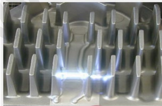
Abbildung 4 - Laserreinigung an einem stark strukturierten Bauteil mit erkennbarer, reflektierter Strahlung

Aus der Zusammensetzung der abzutragenden Schicht und der Beschaffenheit der Materialoberfläche können sich weitere Gefährdungen ergeben, die bei der Planung der Arbeiten berücksichtigt werden müssen. Das betrifft Gefahrstoffe, die durch thermische Zersetzung aus den Beschichtungsstoffen freigesetzt werden können und die Reflexionseigenschaften der Oberfläche, die sowohl die Intensität als auch die Ausbreitung der reflektierten und gestreuten Strahlung beeinflussen. Dabei spielt auch die Geometrie des Werkstücks eine Rolle. Winkel, Rohre, Schweißnähte etc. führen zu einer veränderten Strahlausbreitung.